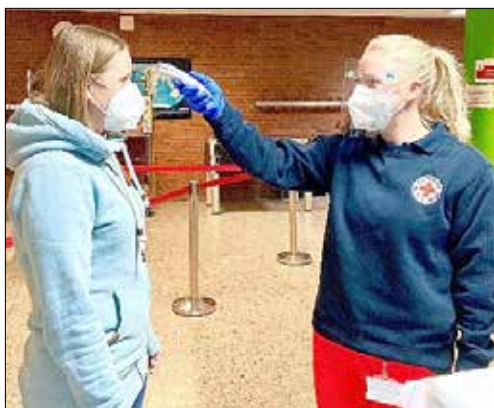
Einlasskontrolle vor der Blutspende mit Temperaturmessung

Vor dem Hintergrund der Corona-Pandemie wird das Infektionsrisiko dadurch so gering wie möglich gehalten - Blutversorgung muss auch über Ostern gesichert sein