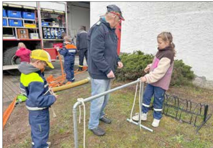
Das Erlernen der Knotentechnik fordert einiges an Geschick.

Die Kinder übten in Falkenberg mit viel Elan in den verschiedenen Bereichen wie 1. Hilfe, Feuerwehr- und Knotentechnik, damit sie den Anforderungen zum Erwerb der Kinderflamme gerecht werden.