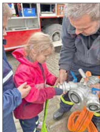
Die erfahrenen Feuerwehrmänner zeigten den Umgang mit der Feuerwehrtechnik.