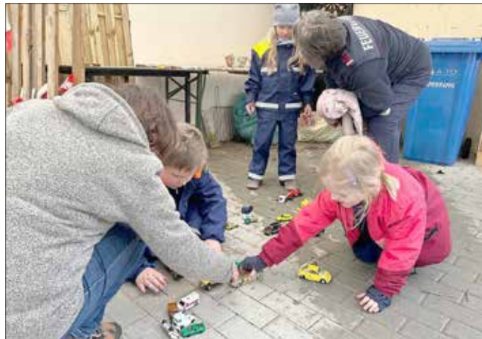
Spielerisch ging es beim Bilden einer Rettungsgasse zu.