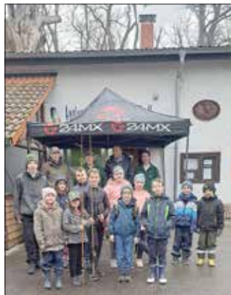
Kinder die beim Kinderangeln teilnahmen.

Trotz des durchwachsenen Wetters erfreute sich die Veranstaltung „Kleine Ostern“ in Dahlenberg am Anglerheim wieder größerer Besucherzahlen. Für die Veranstalter, den Anglerverein „Eisvogel“ e.V., ist es immer ein Zeichen, dass es eine große Bereicherung im Dorfleben der Gemeinde Trossin ist und von den Einwohnern wertgeschätzt wird. Zum Kinderangeln um 9:00 Uhr fanden sich 12 Kinder am Dorfteich ein. Die Fische waren auch an diesem Morgen sehr beifreudig. Großen Andrang gab es auch wieder beim Ostereierkullern. Die Stände mit Getränken, Ge grilltem und frisch geräucherten Forellen waren dicht umlagert. Bei der Schnipseljagd für Kinder beteiligten sich über 20 Kinder. Schnell waren die versteckten Schokohasen, Ostereier und Überraschungen am Weg hinter den Dorfteich gefunden. Ein großes Dankeschön an alle freiwilligen Helfer und Unterstützer der Veranstaltung.