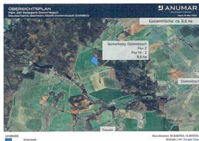
Übersicht der Fläche

Nach Erstellung des Planentwurfes wird der Entwurf samt Begründung öffentlich ausgelegt. Hierauf werden wir durch Bekanntmachung hinweisen.