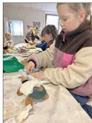
Viel Spaß gab es im Bereich 1. Hilfe, beim Erlernen des richtigen Anlegens eines Verbandes.