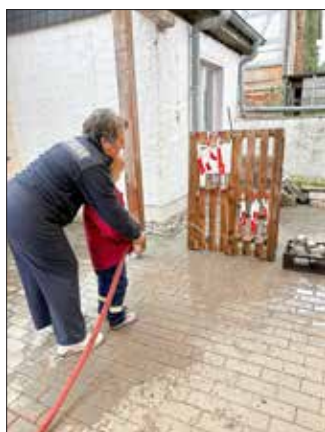
An der Kübelspritze wurde das Zielspritzen geübt.