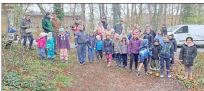
Die Kinder konnten kaum den Start zur Schnipseljagd erwarten.