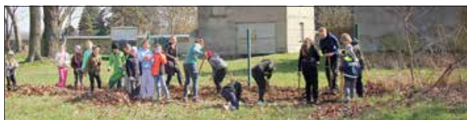
Kinder der Jugendfeuerwehr beim Anlegen der Blühwiese in Roitzsch