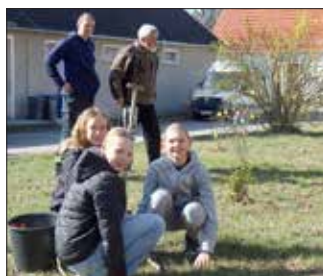
Kinder der Jugendfeuerwehr Trossin beim Stecken von Frühblühern