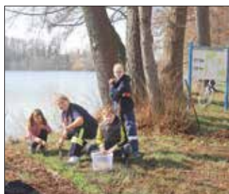
Kinder der Jugendfeuerwehr Trossin am Schlossteich bei der Pflanzaktion