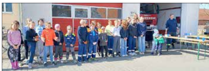
Abschluss der Umweltaktion vor der Feuerwehr Trossin