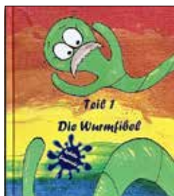
Text/Foto: ASB Torgau-Oschatz e. V.

Interessenten sowie Kindergruppen können sich gern im Mehrgenerationenhaus über weitere Angebote unter der Telefonnummer 034223 60381 informieren.