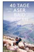
2018 © Bibliothek Dommitzsch