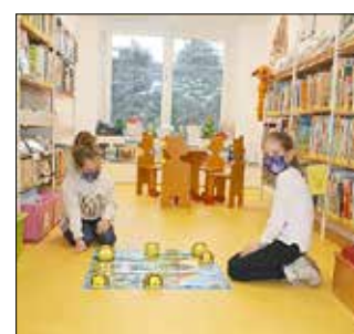
... und die Bee-Bots in der Kinderbibliothek.