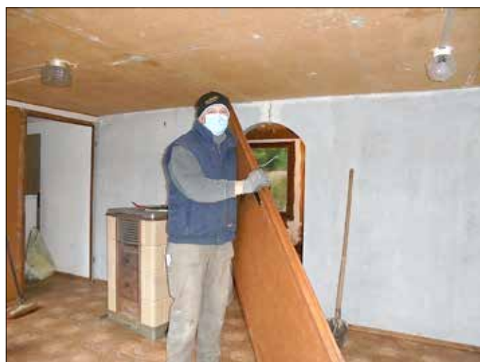
Bevor die Trockenbauarbeiten beginnen können, muss Baufreiheit geschaffen werden.

Vorbereitungsraum sowie zur Auslage von Informationsmaterialien genutzt werden können. Für den Bauhof werden Abstellmöglichkeiten, die durch eine separate Eingangstür getrennt zu erreichen sind, geschaffen. Hier können alle Gerätschaften zur Pflege, Reinigung und Müllentsorgung abgestellt werden.